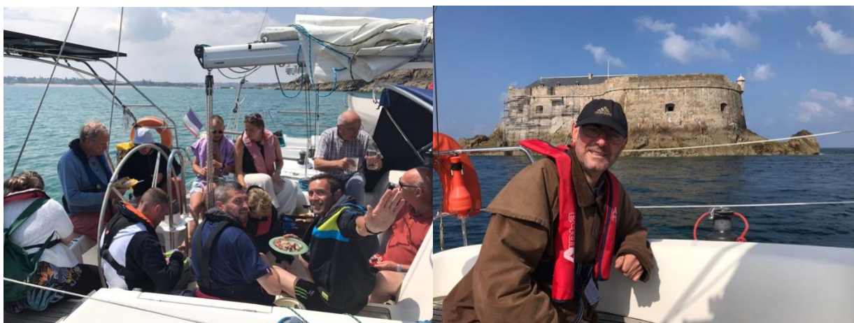
Repas au mouillage devant les Ebihens, les quatre bateaux à couple

marine. Le clou du spectacle aura été d'observer des dauphins lors du pique-nique proche de l'île des Ebihens !. Nous sommes rentrés avec le sourire aux lèvres et des étoiles dans les yeux. »