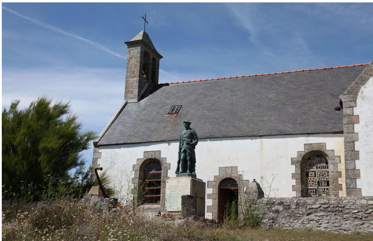
Église Notre Dame La Blanche, Île d'Hœdic