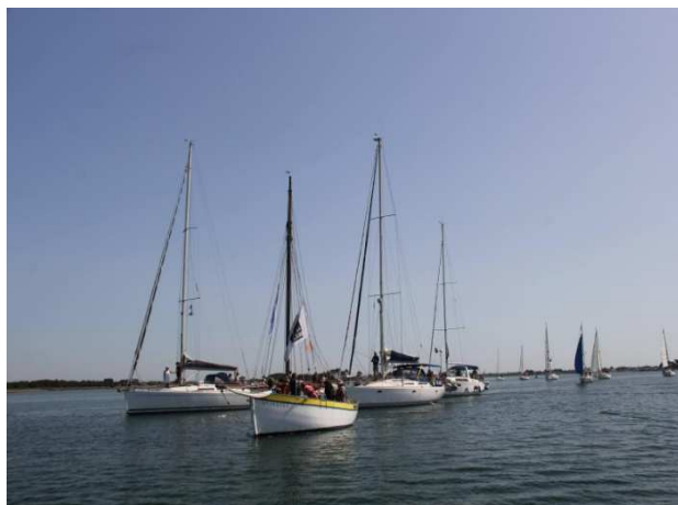
Le « Reder Mor » avec l'évêque de Vannes à son bord et la flotte des bateaux de Cap Vrai.